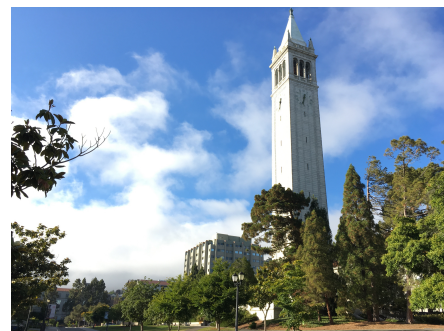
写真：UCBのSather Tower. その左に写っている建物は統計学部があるEvans Hall

学術的にも、UCBは時空間統計解析と環境統計学を含む応用分野への研究が盛んで、私の興味と重なることに加え、教授陣も多彩で政府や企業との連携プロジェクトに積極的に参加し社会貢献に寄与しています。またUCB-geneとでも言うのでしょうか、UCBを卒業した人が大学や国際研究機関で多く働いているということも多様なキャリアの可能性を示唆していると思いました。