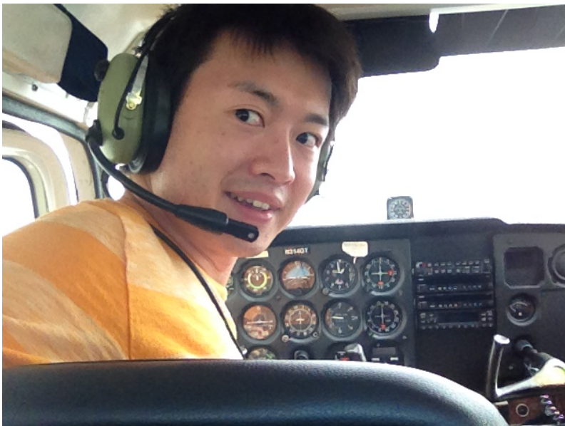
(セスナ 172N の中)

僕はパデューではサークルで所有している Piper Warrior 2 という飛行機でトレーニングしました. ジョージア工科大学では Cessna172N という飛行機を使います. どちらも最初の免許を取るのには一般的なクセのない飛行機だと思います. 友人にもよく「セスナとか操縦できるの?」と聞かれるように, 小型機の代表と言えばセスナなのでしょう.